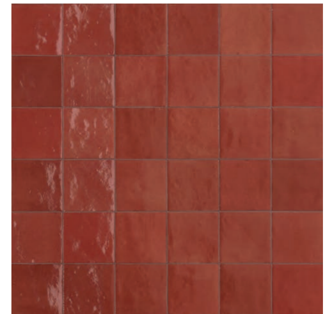
R8G2 Mélange Bordeaux 10x10 - 3 15/16 "x3 15/16 "