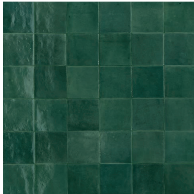
R8GA Mélange Teal 10x10 - 3 15/16 "x3 15/16 "