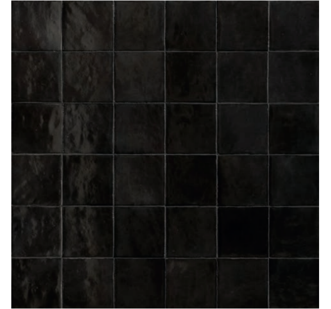
R8GF Mélange Nero 10x10 - 3 15/16 "x3 15/16 "