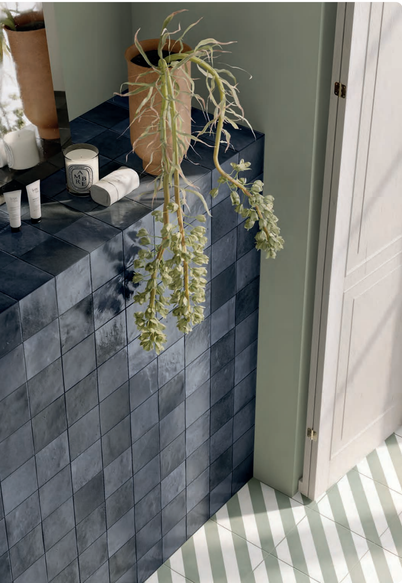
R8GE Mélange Oltremare 10x10 - 3 15/16 "x3 15/16 " R7HP Contrasti Tappeto 10 20x20 - 7 7/8 "x7 7/8 "