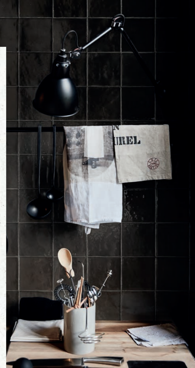
R8GF Mélange Nero 10x10 - 3'15"16" x 3'15"16"

Коллекция Mélange вдохновлена материалом с богатой историей и традицией. Этот удачный союз традиций и дизайна развивает и переосмысливает тему цвета, раскрывая неожиданный современный характер. Девять разных оттенков играют с правильными формами, блеском глазури на плитке, яркая цветовая насыщенность которой обусловлена почти бесконечными графическими элементами, предложенными для каждого из 9 цветов.