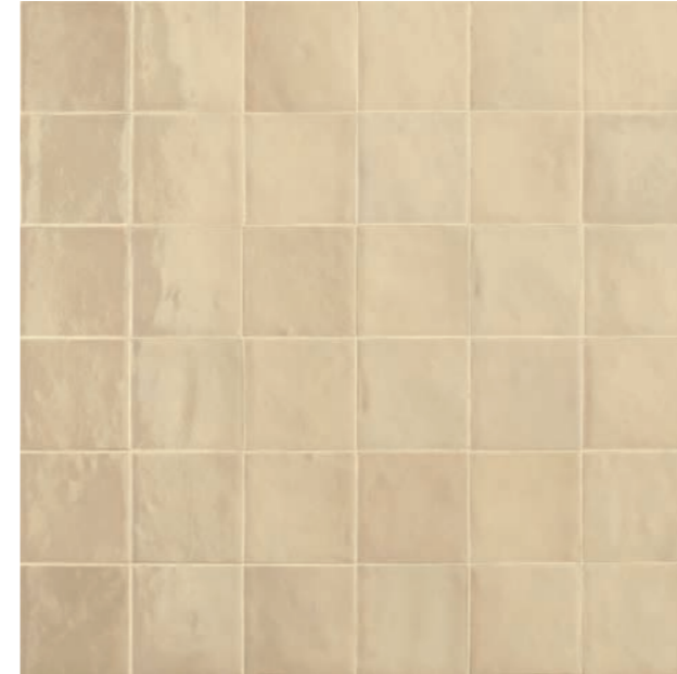
R8G0 Mélange Beige 10x10 - 3 15/16 "x3 15/16 "