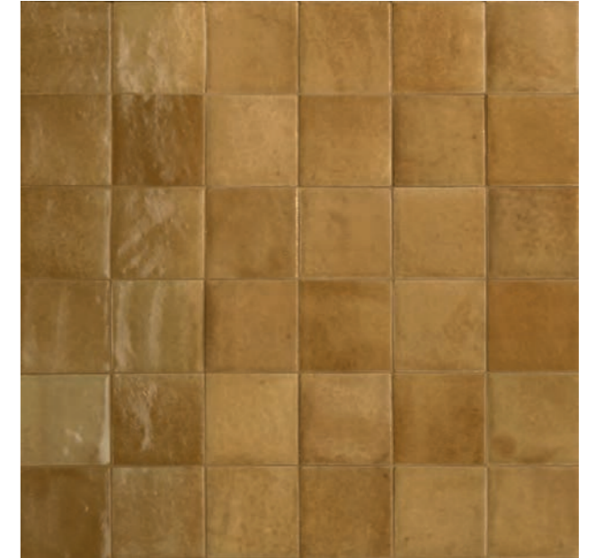
R8G1 Mélange Kaki 10x10 - 3 15/16 "x3 15/16 "