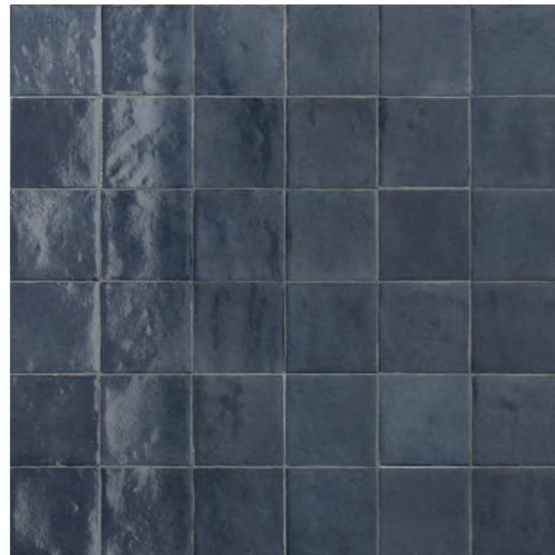
R8GE Mélange Oltremare 10x10 - 3 15/16 "x3 15/16 "