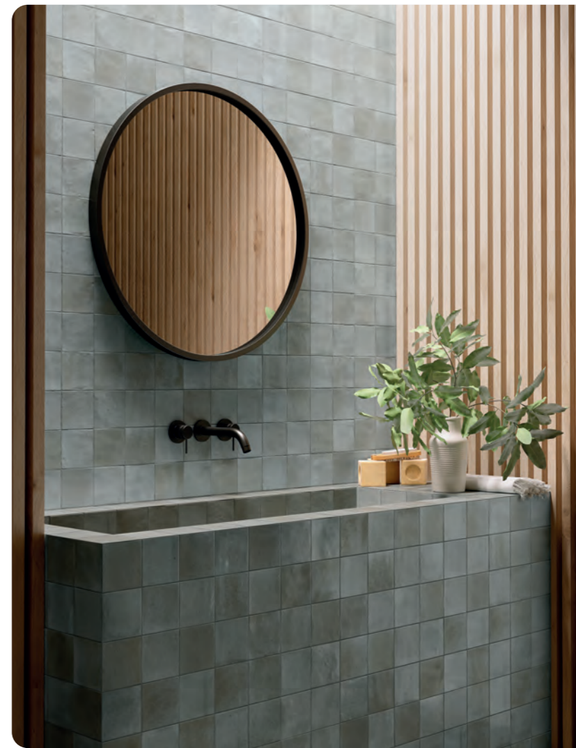
R8GC Mélange Glicine 10x10 - 3'15/16" x 3'15/16"

R8GC Mélange Glicine 10x10 - 3'15/16" x 3'15/16" R7AK Realstone_Lunar Uniform rett. 75x150 - 29'12" x 59'16"