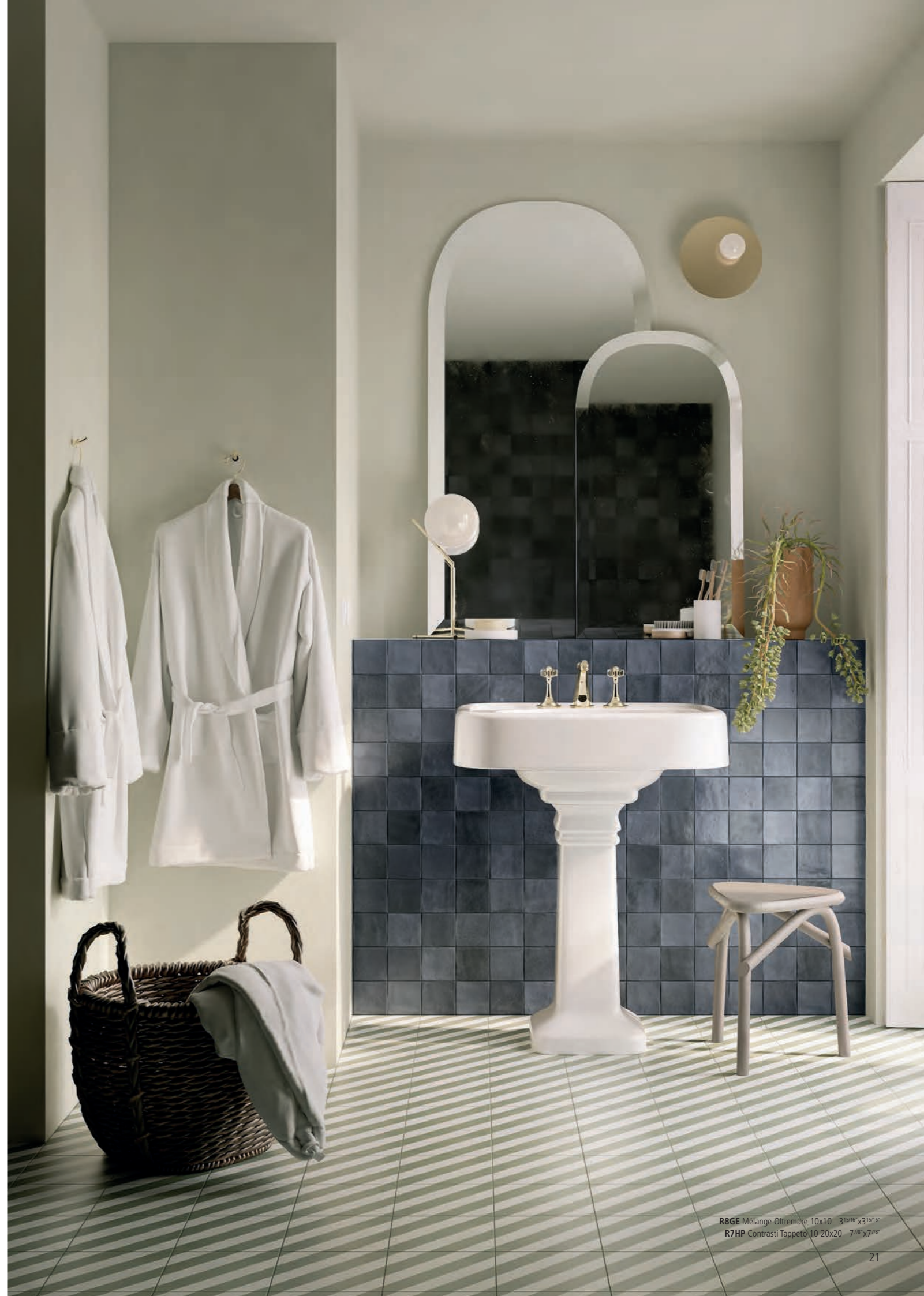
R8GE Mélange Oltremare 10x10 - 3 15/16 "x3 15/16 " R7HP Contrasti Tappeto 10 20x20 - 7 7/8 "x7 7/8 "