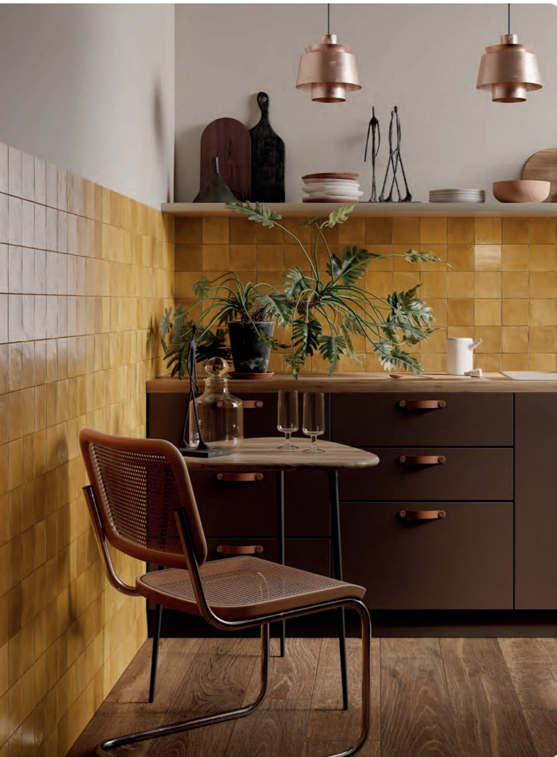
R8G1 Mélange Kaki 10x10 - 3 15/16 "x3 15/16 " R7FR Woodsense Marrone rett. 19x150 - 7 1/2 "x59 1/8 "