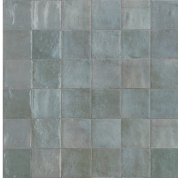
R8GC Mélange Glicine 10x10 - 3 15/16 "x3 15/16 "

superfici / surfaces / oberflächen / finitions / superficies / поверхности: glossy