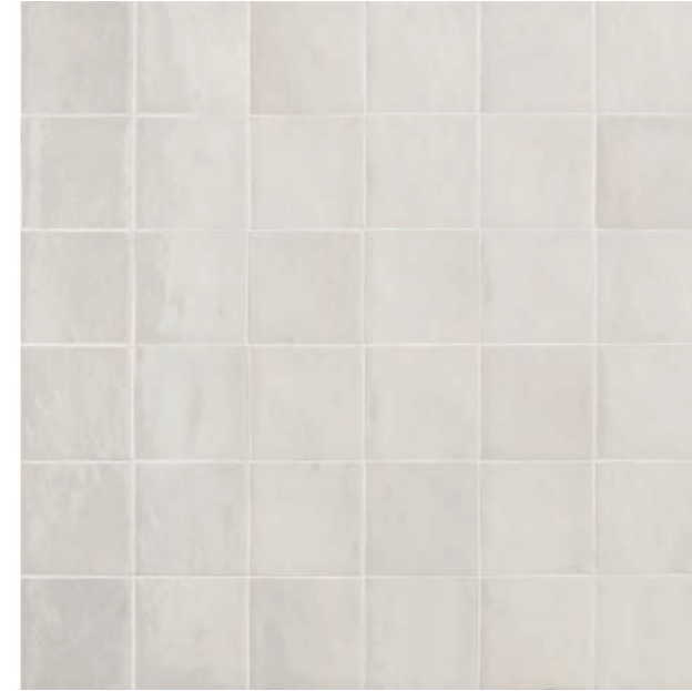
R8FZ Mélange Bianco 10x10 - 3 15/16 "x3 15/16 "