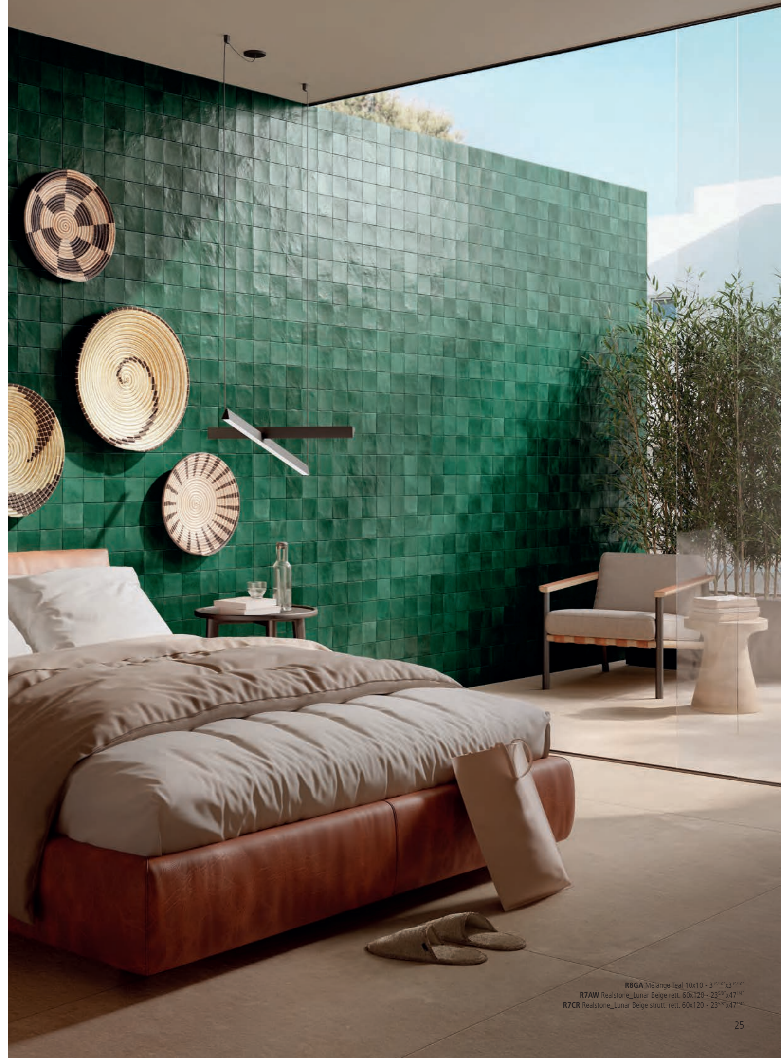
R8GA Mélange Teal 10x10 - 3 15/16 "x3 15/16 " R7AW Realstone_Lunar Beige rett. 60x120 - 23 5/8 "x47 1/4 " R7CR Realstone_Lunar Beige strutt. rett. 60x120 - 23 5/8 "x47 1/4 "