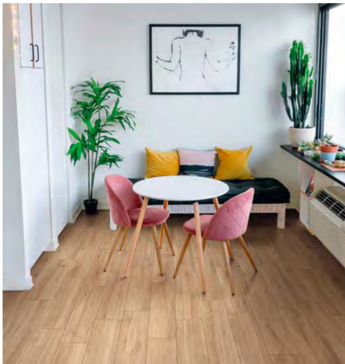
RA3M Beige 15,5x60,5 - 6 1 / 8 "x23 13 / 16 "

gres porcellanato / porcelain stoneware / feinsteinzeug / grès cérame émaillé / gres porcelánico / керамогранит