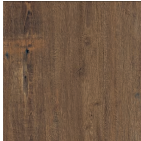
R7LG Woodsense XT20 Marrone rettificato 60x60