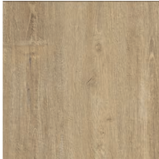
R7LF Woodsense XT20 Beige rettificato 60x60

superfici / surfaces / finitions / oberflächen / superficies / поверхности: outdoor