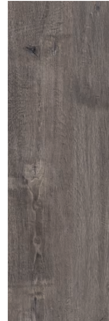
R7LA Woodsense XT20 Marrone rettificato 40x120