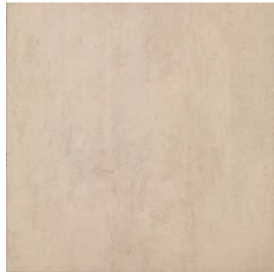
R45P Concept XT20 Beige rettificato 60x60

superfici / surfaces / finitions / oberflächen / superficies / поверхности: outdoor