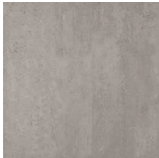
R45M Concept XT20 Grigio rettificato 60x60