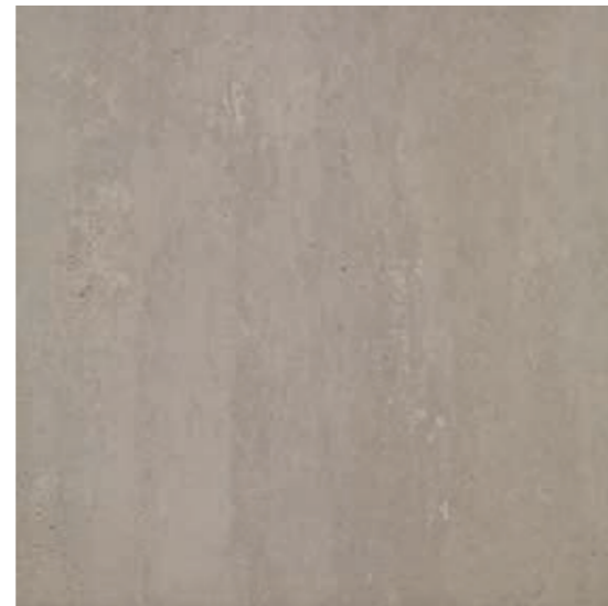
R45N Concept XT20 Greige rettificato 60x60