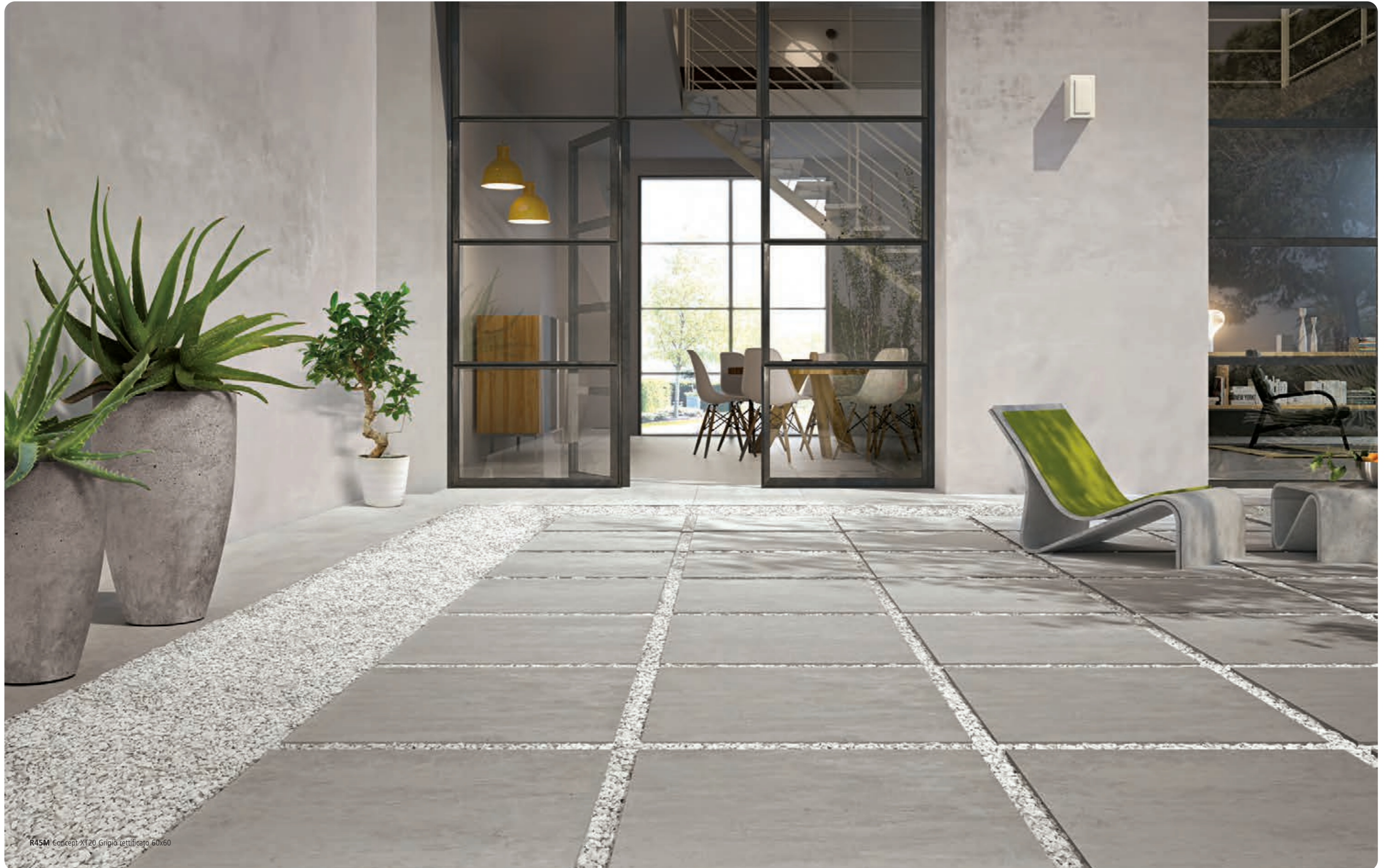
R45M Concept XT20 Grigio tuffato 60x60