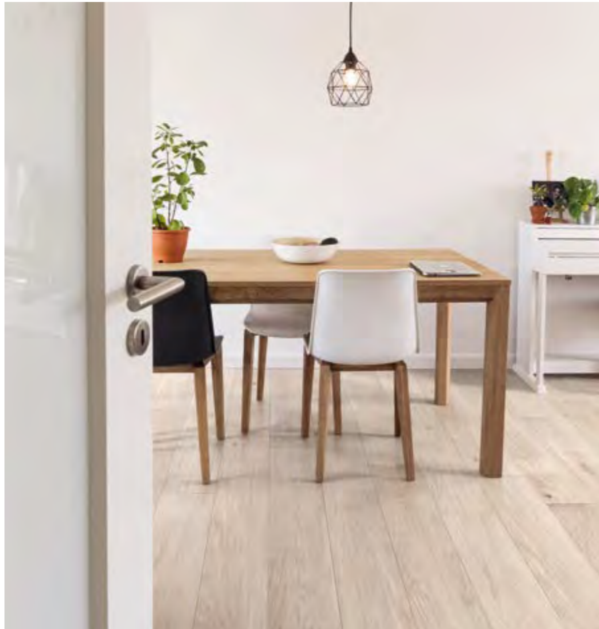
RA4T Essenza Rettificato 20x120 - 7 78 / 16 " x 47 14 / 16 "

gres porcellanato - rettificato monocalibro / porcelain stoneware - rectified monocaliber / feinsteinzeug - rektifiziert, in einem werkmaß / grès cérame émaillé - rectifié monocalibre / gres porcelánico - rectificado monocalibre / керамогранит - ректифицированный монокалиберный