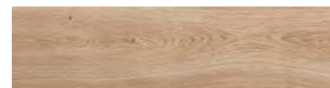
RA4M 14,5x90 Rett