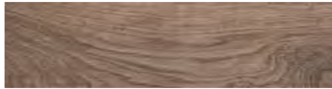
RA4R 14,5x90 Rett