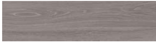
RA4Q 14,5x90 Rett