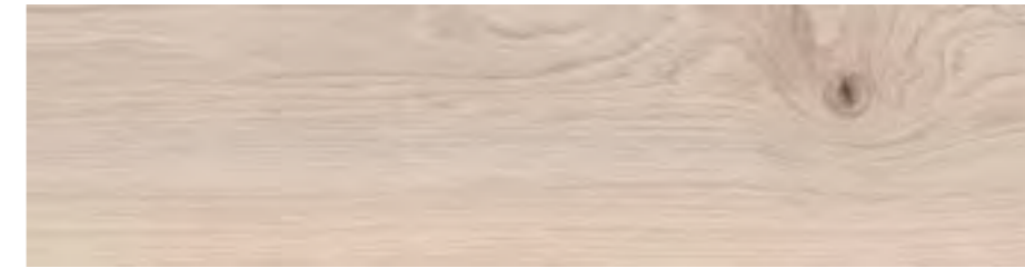
RA4T 20x120 Rett