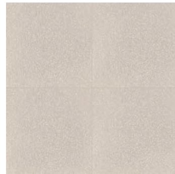
R62P Abitare Bianco 20x20 - 7 7/8" x 7 7/8" G