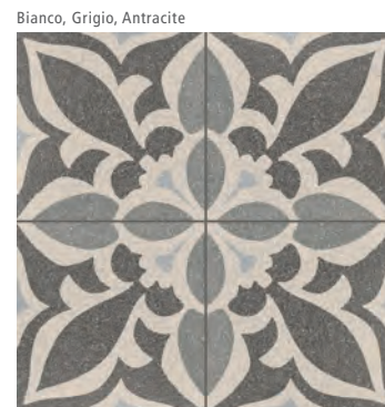
R631 Abitare Tappeto 3* 20x20 - 7 7/8" x 7 7/8" H