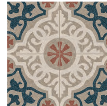
R637 Abitare Tappeto 8* 20x20 - 7 7/8" x 7 7/8" H