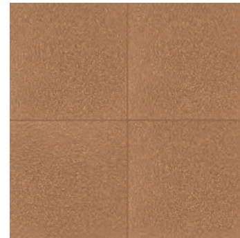
R62U Abitare Arancio 20x20 - 7 7/8" x 7 7/8" H