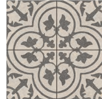
R635 Abitare Tappeto 7* 20x20 - 7 7/8" x 7 7/8" G