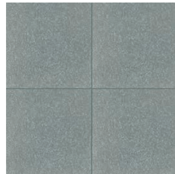
R62V Abitare Azzurro 20x20 - 7 7/8" x 7 7/8" G