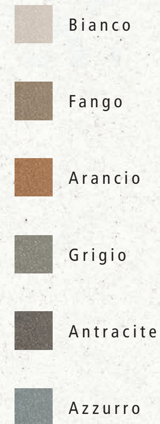
ABITARE Porcelain Stoneware 20x20 Motifs with an art deco spirit