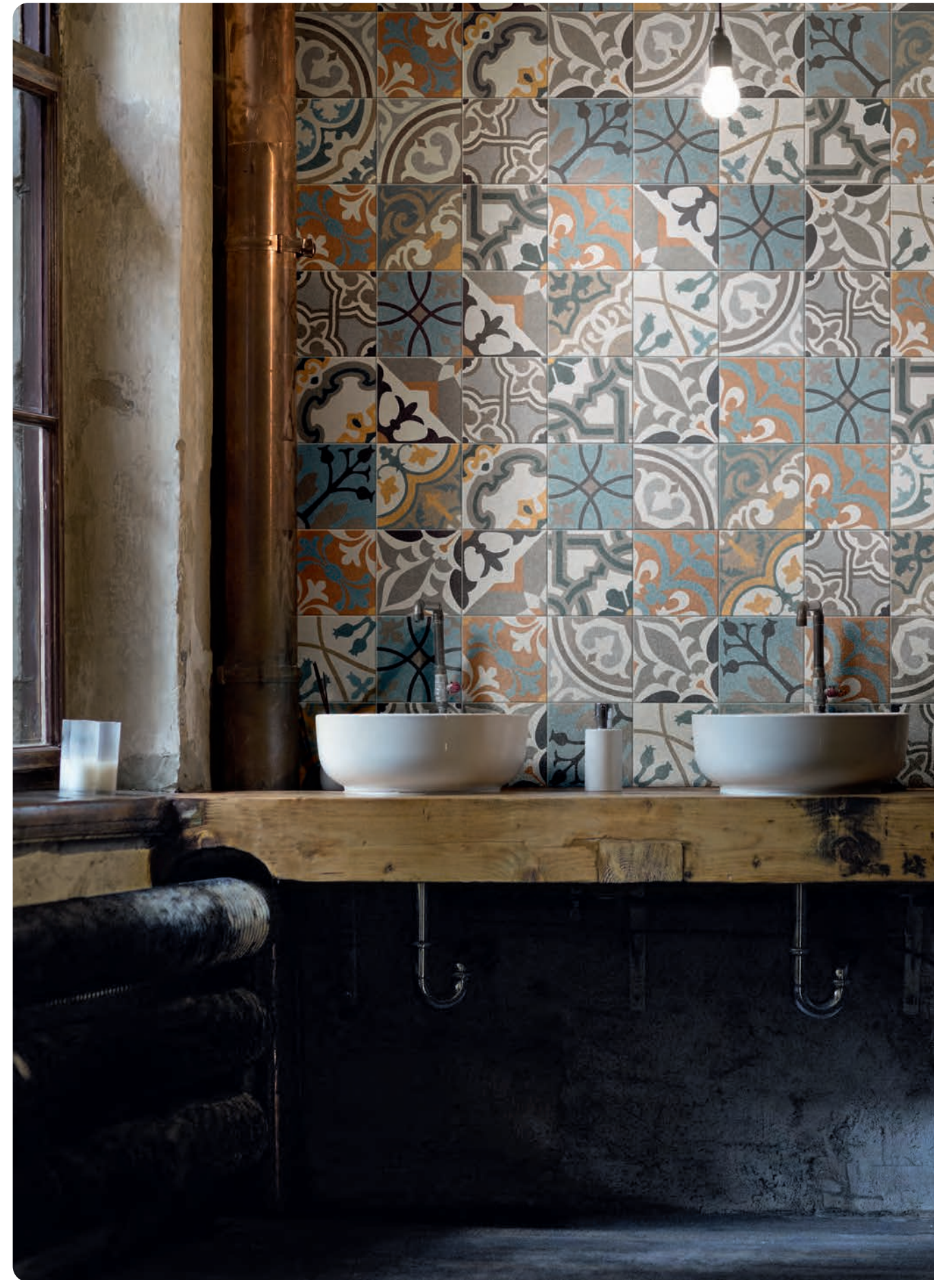
R639 Abitare Mix 20x20 - 7 16 x 7 16