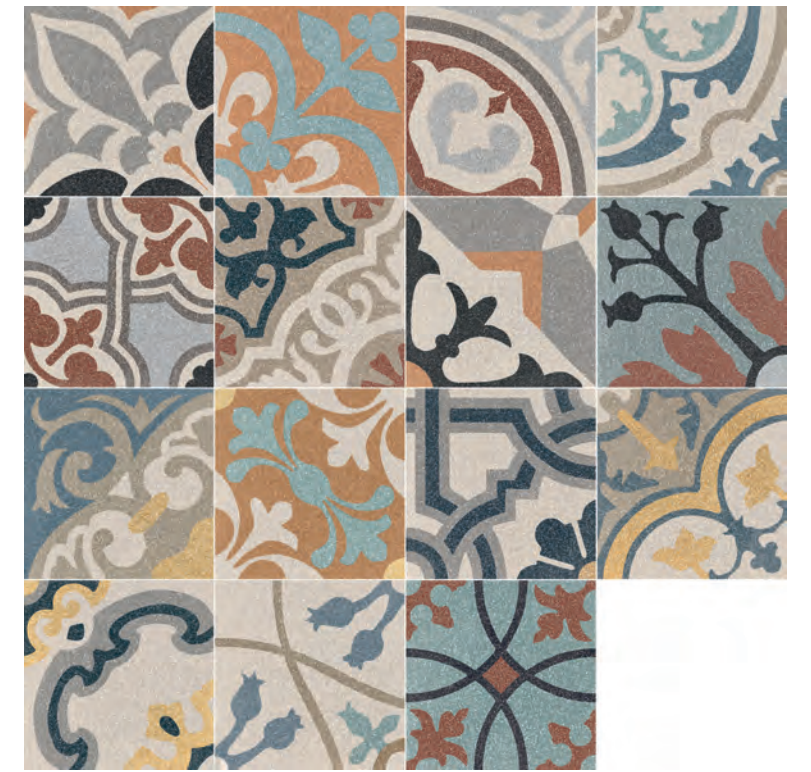
R639 Abitare Mix** 20x20 - 7 7/8" x 7 7/8" H