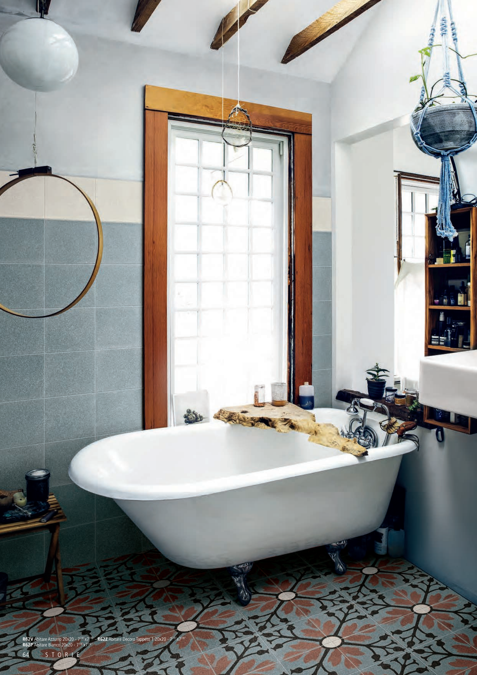
R62V Abitare Azzurro 20x20 - 7 16 x 7 16 - R62Z Abitare Decoro Tappeto 1. 20x20 - 7 16 x 7 16 R62P Abitare Bianco 20x20 - 7 16 x 7 16