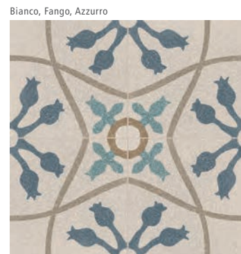
R630 Abitare Tappeto 2* 20x20 - 7 7/8" x 7 7/8" G