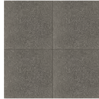
R62W Abitare Antracite 20x20 - 7 7/8" x 7 7/8" G