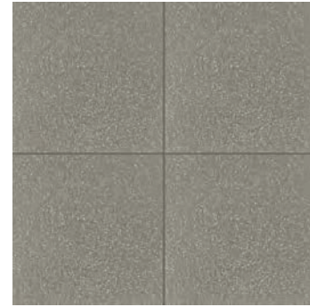
R62S Abitare Grigio 20x20 - 7 7/8" x 7 7/8" G