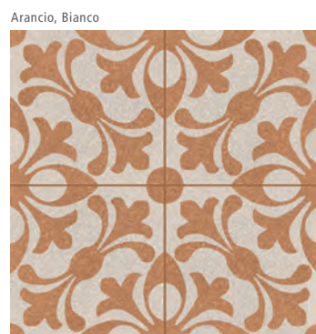
R632 Abitare Tappeto 4* 20x20 - 7 7/8" x 7 7/8" H