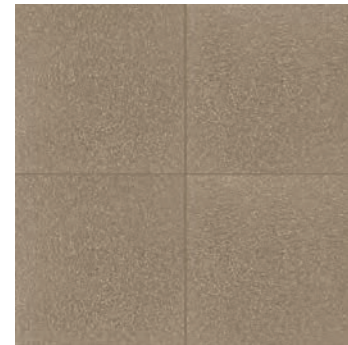
R62T Abitare Fango 20x20 - 7 7/8" x 7 7/8" H