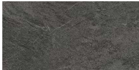
MR5V Quarzite20 Black 50x100