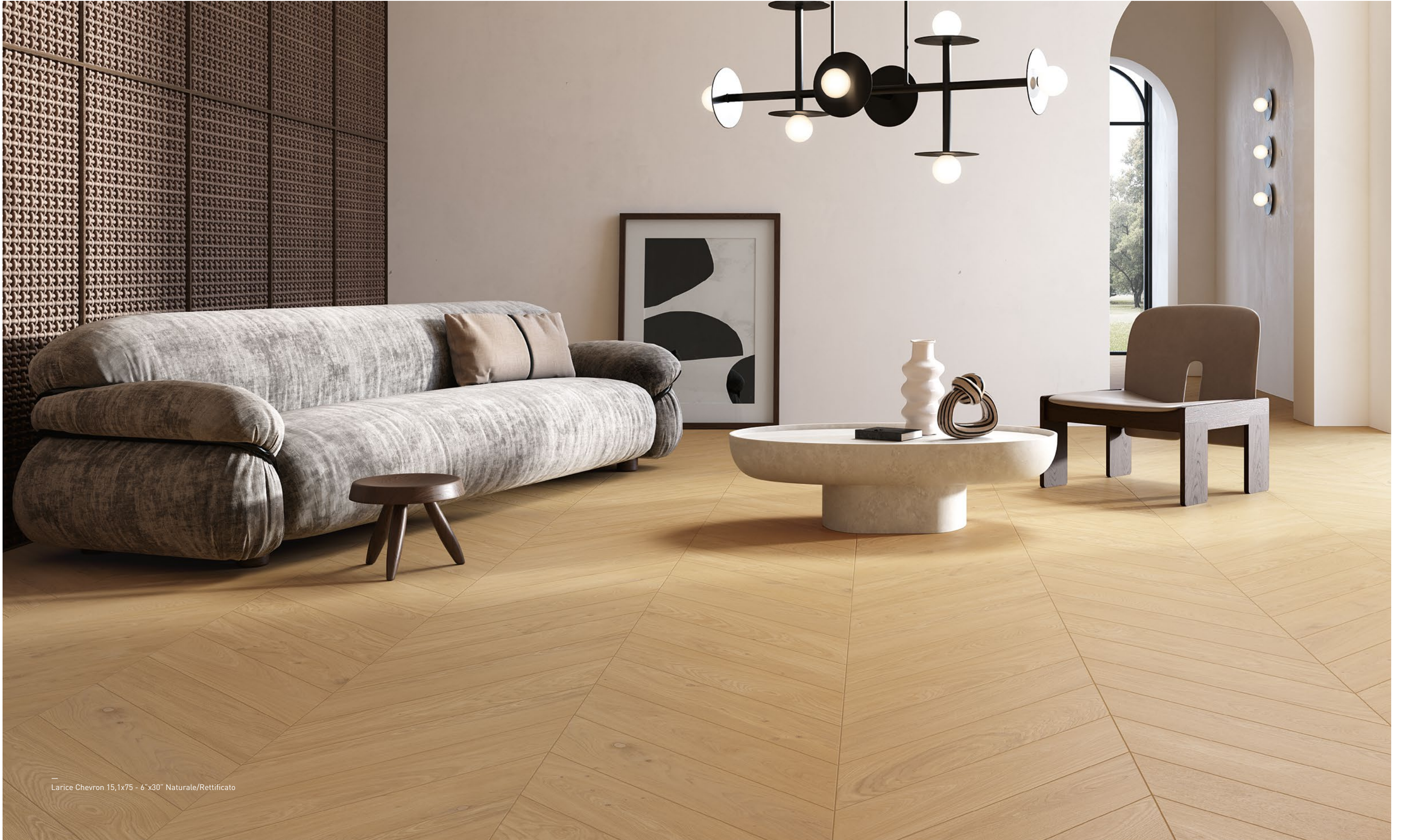
Larice Chevron 15,1x75 - 6"x30" Naturale/Rettificato