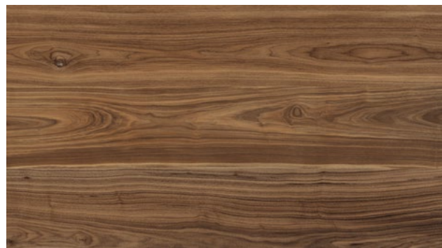
LIGNEA NOCE AMERICANO