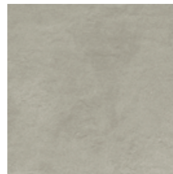
R96T 60x120 Beige Rett