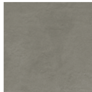
R96X 60x120 Dark Grey Rett