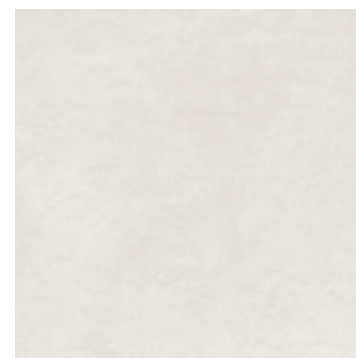
R96V 60x120 White Rett