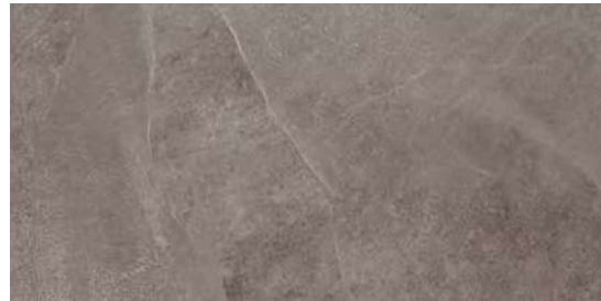
M06V Ardesia20 Cenere Rett.