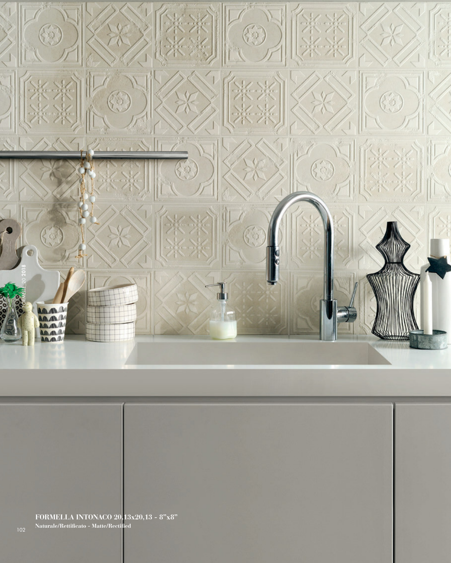
FORMELLA INTONACO 20,13x20,13 - 8"x8" Naturale/Rettificato - Matte/Rectified