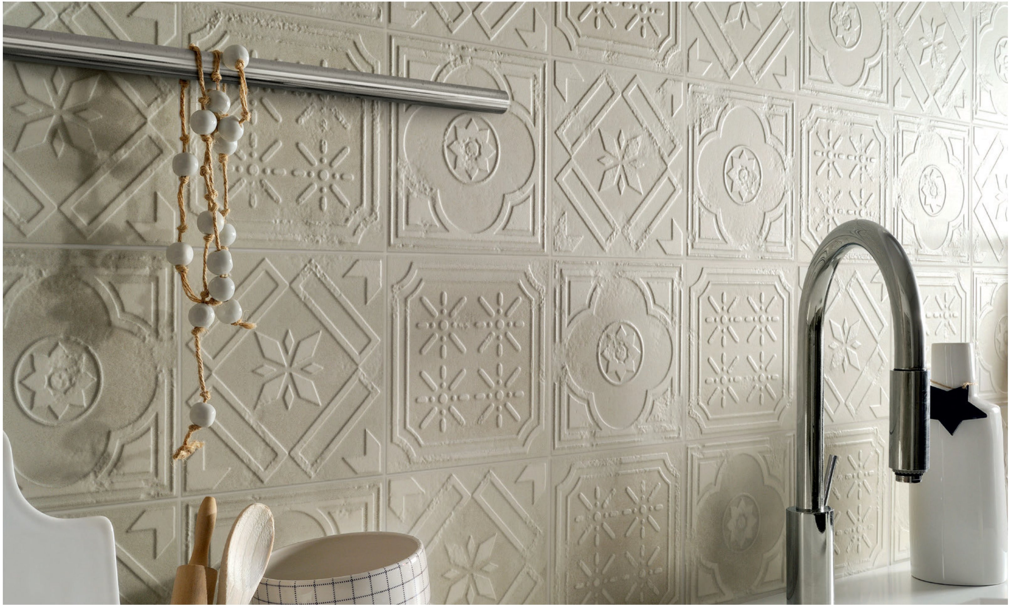
FORMELLA INTONACO 20,13x20,13 - 8"x8" Naturale/Rettificato - Matte/Rectified