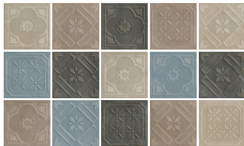
FORMELLA MIX_4 COLORI

3 SOGGETTI ASSORTITI / 20,13x20,13 - 8"x8" Naturale/Rettificato - Matte/Rectified