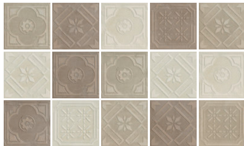
FORMELLA MIX_3 COLORI