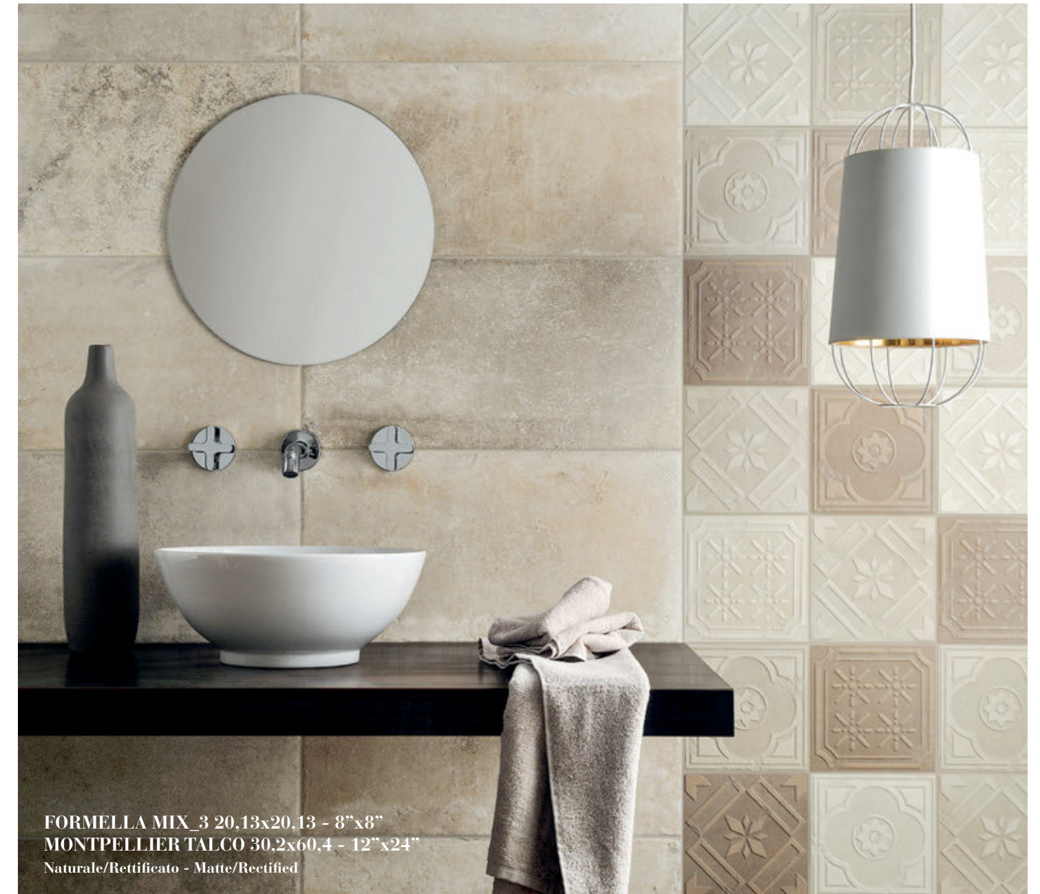
FORMELLA MIX_3 20,13x20,13 - 8"x8" MONTPELLIER TALCO 30,2x60,4 - 12"x24" Naturale/Rettificato - Matte/Rectified