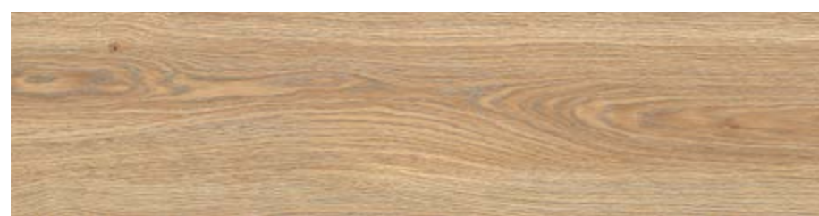
RC6P 20x120 Naturale Rett RC6V 20x120 Naturale Grip Rett