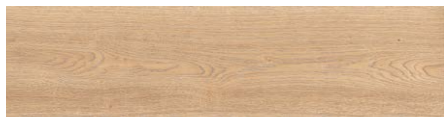
RC6N 20x120 Miele Rett RC6U 20x120 Miele Grip Rett