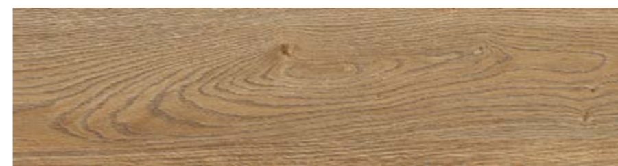
RC6Q 20x120 Rovere Rett RC6W 20x120 Rovere Grip Rett