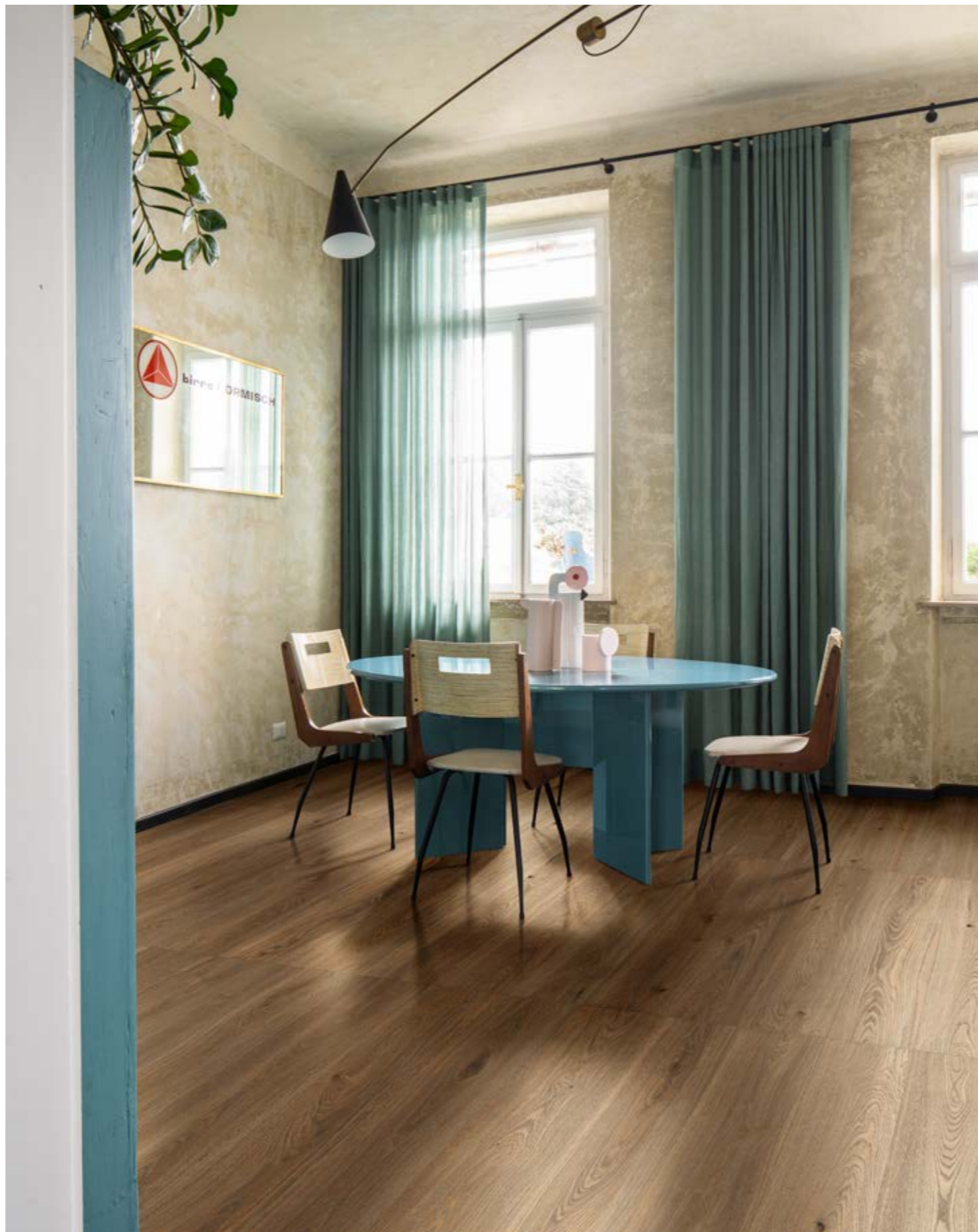
RC6R Secret Marrone Rettificato 20x120 - 77/8" x 47 1/4"