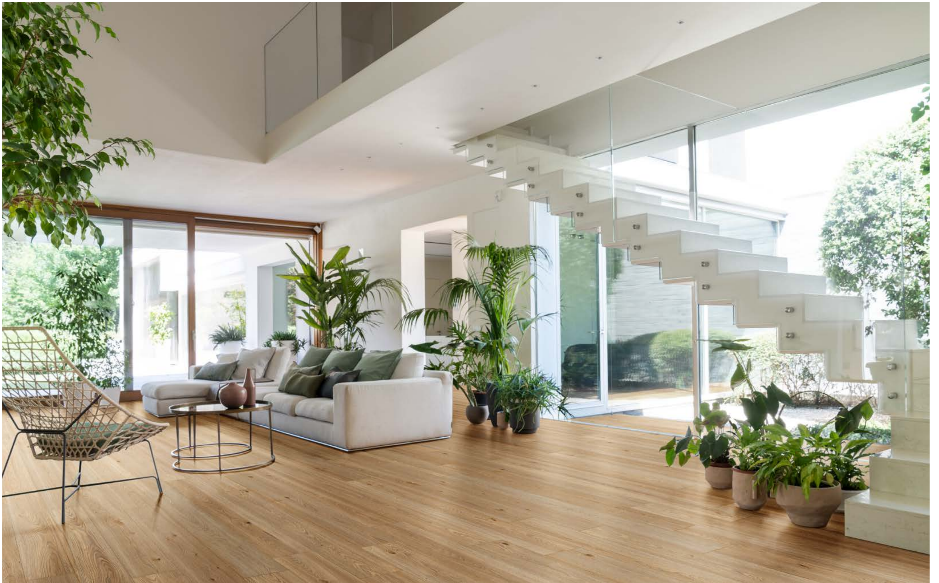
RC6Q Secret Rovere Rettificato 20x120 - 71/8" x 471/4" - RC6W Secret Rovere Grip Rettificato 20x120 - 71/8" x 471/4"