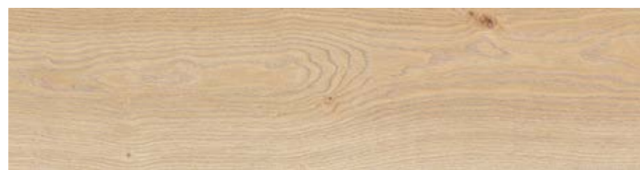
RC6M 20x120 Beige Rett RC6T 20x120 Beige Grip Rett