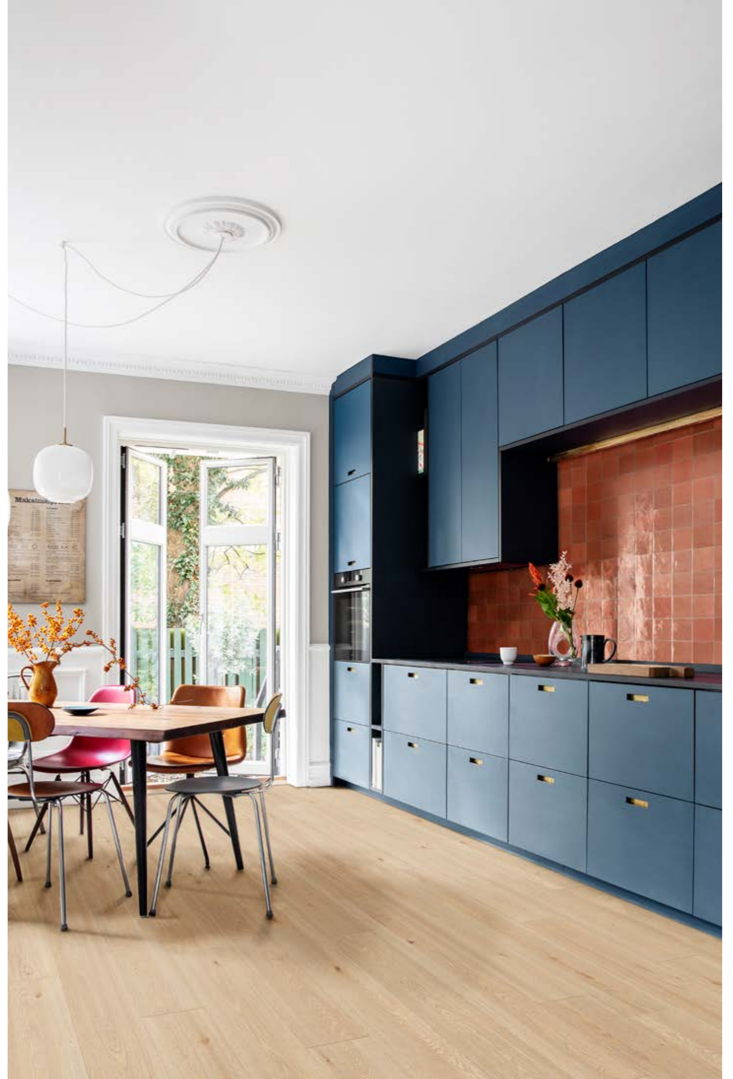
RC6M Secret Beige Rettificato 20x120 - 77/8" x 47 1/4" - R8G2 Mélange Bordeaux Glossy 10x10 - 3 15/16" x 3 15/16"