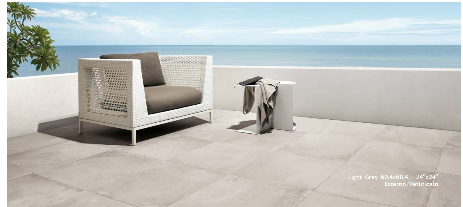
Light Grey 60,4x60,4 - 24"x24" Esterno/Rettificato

CE3MS5R Light Grey CE2MS5R Beige CE7MS5R Dark Grey CE8MS5R Brown