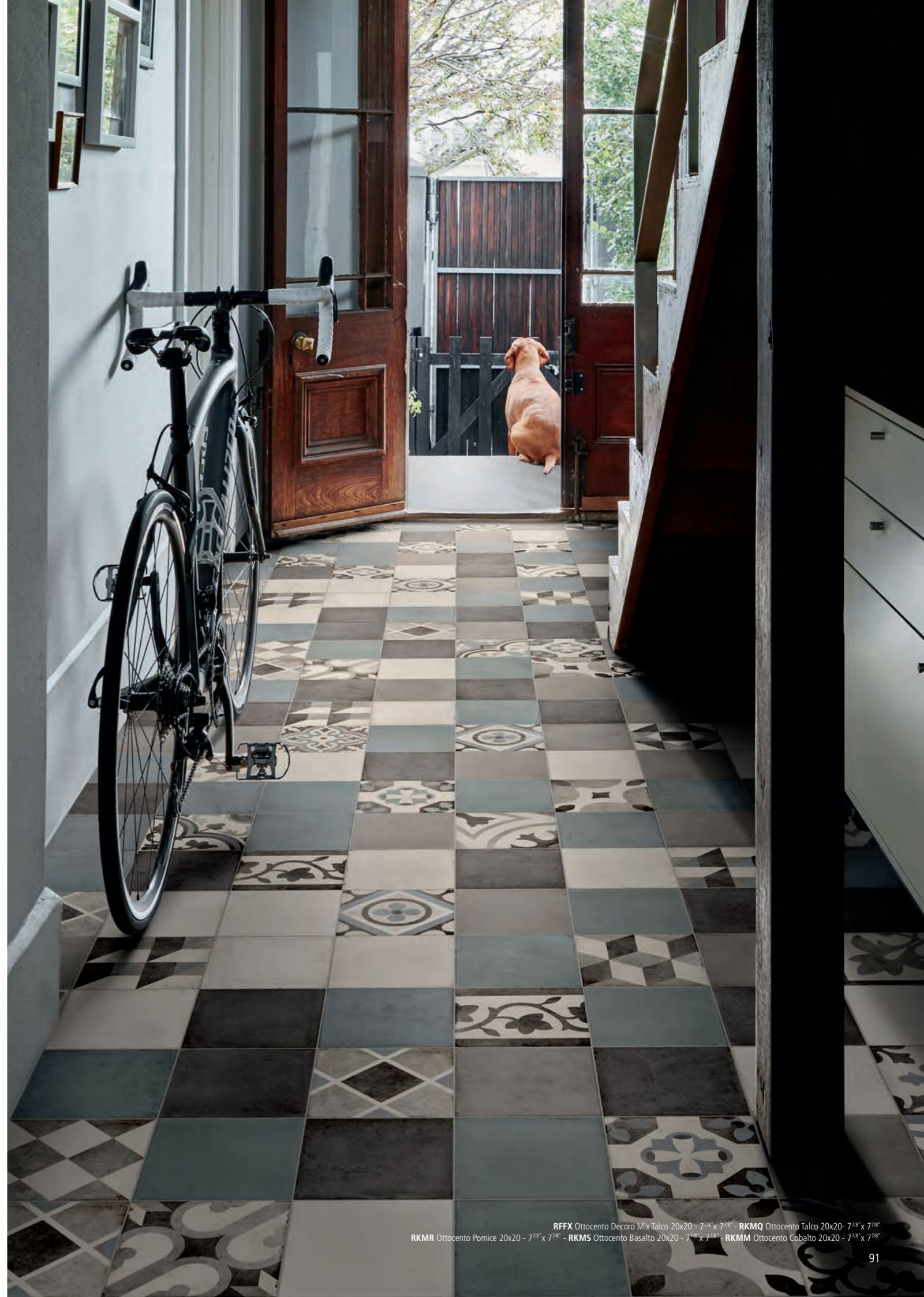
RFFX Ottocento Decoro Mix Talco 20x20 - 7 18 x 7 18 - RKMQ Ottocento Talco 20x20 - 7 18 x 7 18 RKMR Ottocento Pomice 20x20 - 7 18 x 7 18 - RKMS Ottocento Basalto 20x20 - 7 18 x 7 18 - RKMM Ottocento Cobalto 20x20 - 7 18 x 7 18