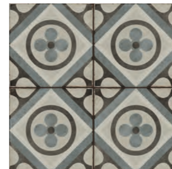
R87F Ottocento Decoro Tappeto 7 Talco 20x20 - 7 7/8" x 7 7/8" H