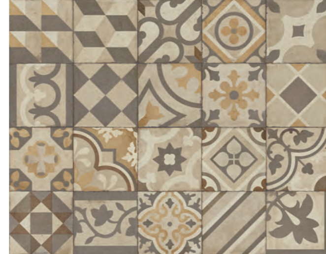
RFFW Ottocento Decoro Mix Ambra** 20x20 - 7 7 / 8 " x 7 7 / 8 " H