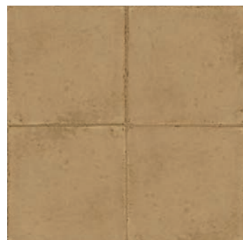
RKMU Ottocento Ocra 20x20 - 7 7/8" x 7 7/8" H