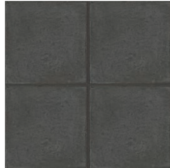
RKMS Ottocento Basalto 20x20 - 7 7/8" x 7 7/8" H