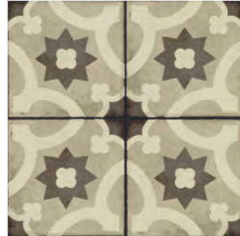
R86S Ottocento Decoro Tappeto 2 Ambra* 20x20 - 7 7 / 8 " x 7 7 / 8 " H