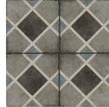
R86Z Ottocento Decoro Tappeto 1 Talco 20x20 - 7 7/8" x 7 7/8" H