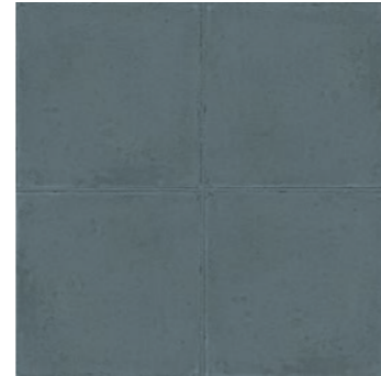
RKMM Ottocento Cobalto 20x20 - 7 7/8" x 7 7/8" G