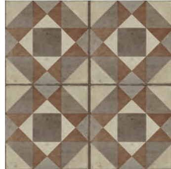
R86T Ottocento Decoro Tappeto 3 Ambra 20x20 - 7 7 / 8 " x 7 7 / 8 " H