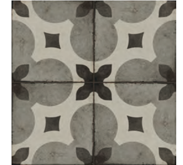
R87E Ottocento Decoro Tappeto 6 Talco* 20x20 - 7 7/8" x 7 7/8" H