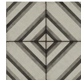
R87G Ottocento Decoro Tappeto 8 Talco* 20x20 - 7 7/8" x 7 7/8" H