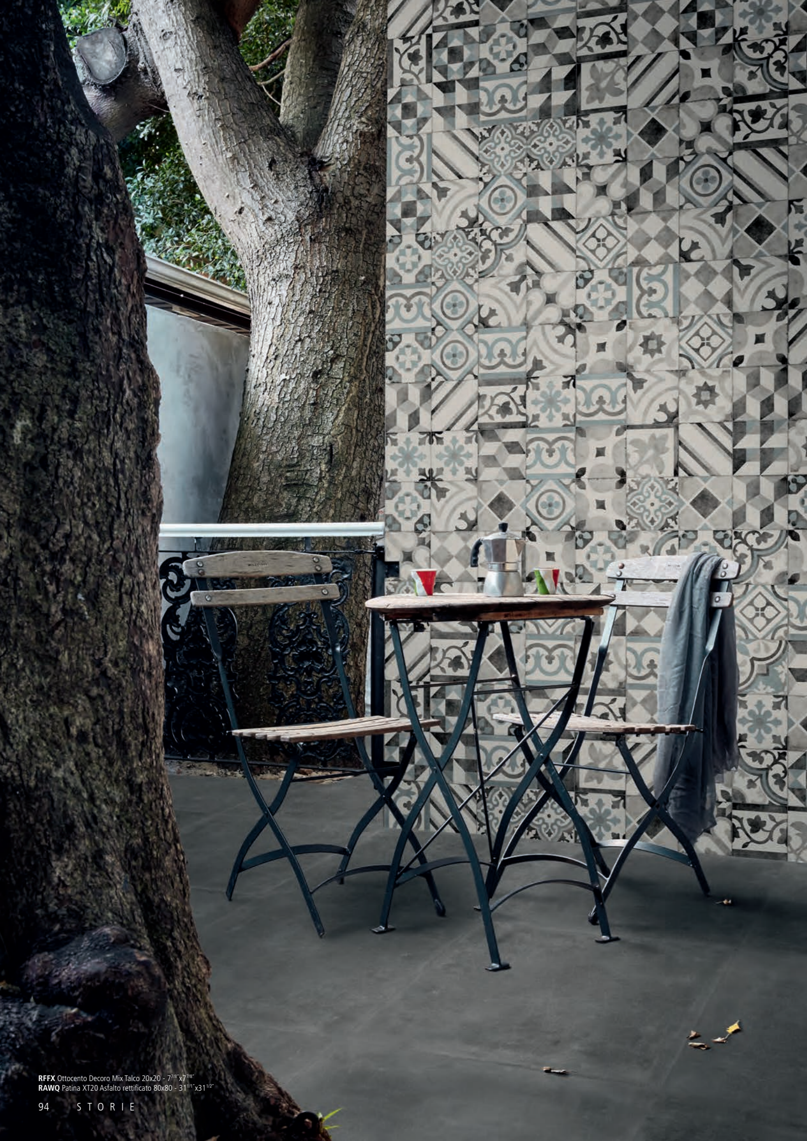
RFFX Ottocento Decoro Mix Talco 20x20 - 7 18 x 7 18 RAWQ Patina XT20 Asfalto rettificato 80x80 - 31 11 x 31 12