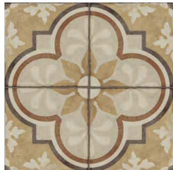
R86U Ottocento Decoro Tappeto 4 Ambra* 20x20 - 7 7 / 8 " x 7 7 / 8 " H