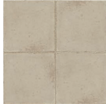
RKMP Ottocento Ambra 20x20 - 7 7/8" x 7 7/8" H