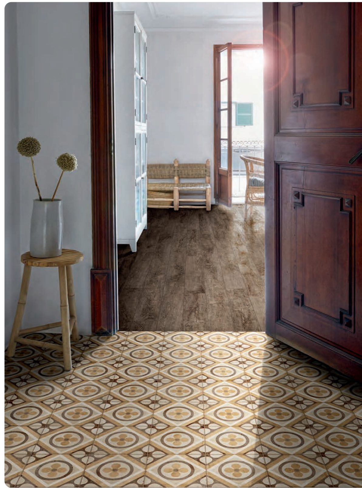
R86X Ottocento Decoro Tappeto 7 Ambra 20x20 - 7 1/8 "x7 1/8 " RGEX Woodchalet Brown 15x90 - 5 7/8 "x35 7/16 "