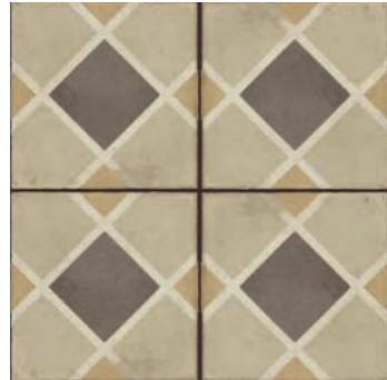
R86R Ottocento Decoro Tappeto 1 Ambra 20x20 - 7 7 / 8 " x 7 7 / 8 " H