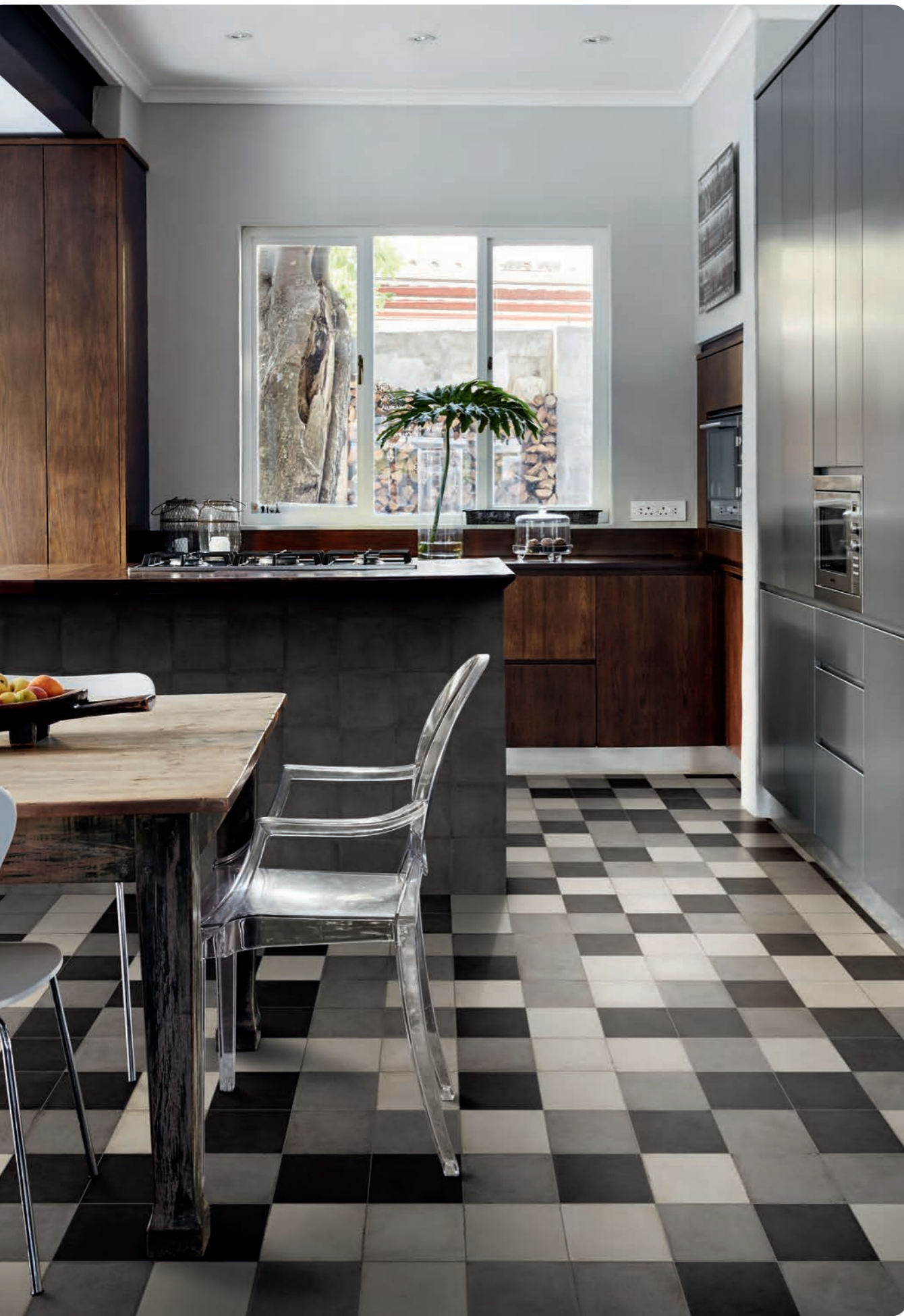
RKMS Ottocento Basalto 20x20 - 7 18 x 7 18 - RKMQ Ottocento Talco 20x20 - 7 18 x 7 18 RKMR Ottocento Pomice 20x20 - 7 18 x 7 18