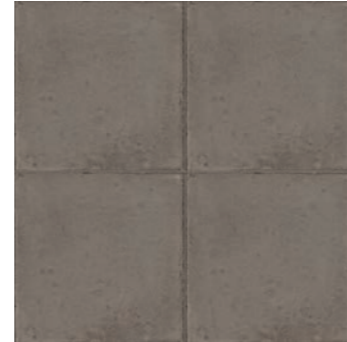
RKMN Ottocento Terra 20x20 - 7 7/8" x 7 7/8" H