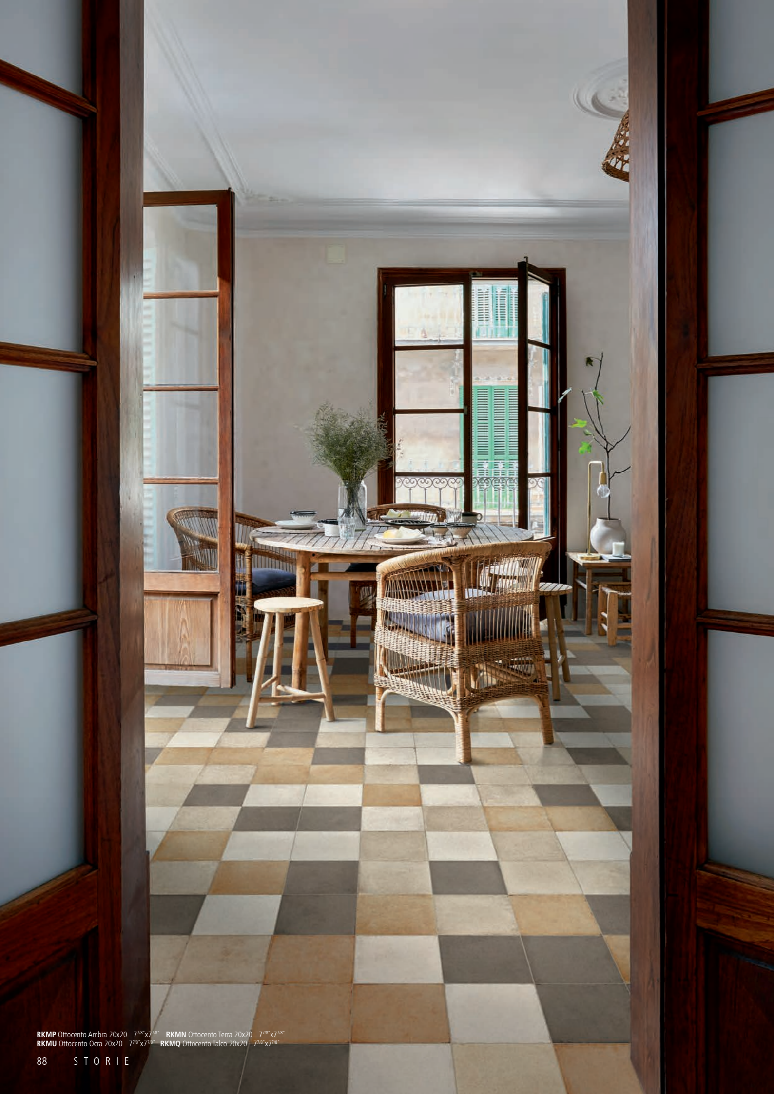
RKMP Ottocento Ambra 20x20 - 7 1/8 "x7 1/8 " - RKMN Ottocento Terra 20x20 - 7 1/8 "x7 1/8 " RKMU Ottocento Ocra 20x20 - 7 1/8 "x7 1/8 " - RKMQ Ottocento Talco 20x20 - 7 1/8 "x7 1/8 "