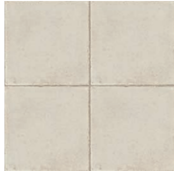
RKMQ Ottocento Talco 20x20 - 7 7/8" x 7 7/8" H