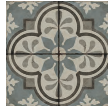
R87C Ottocento Decoro Tappeto 4 Talco* 20x20 - 7 7/8" x 7 7/8" H