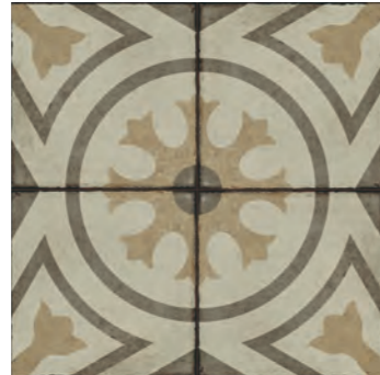
R86V Ottocento Decoro Tappeto 5 Ambra* 20x20 - 7 7 / 8 " x 7 7 / 8 " H