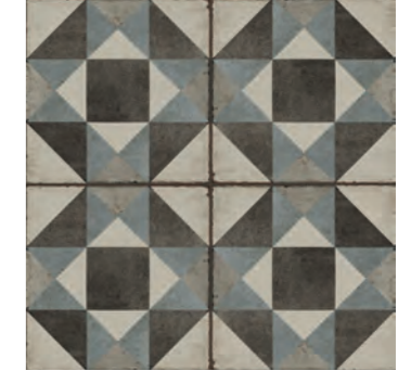
R87A Ottocento Decoro Tappeto 3 Talco 20x20 - 7 7/8" x 7 7/8" H