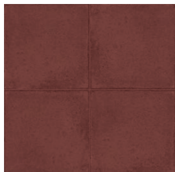
RKMT Ottocento Cadmio 20x20 - 7 7/8" x 7 7/8" H