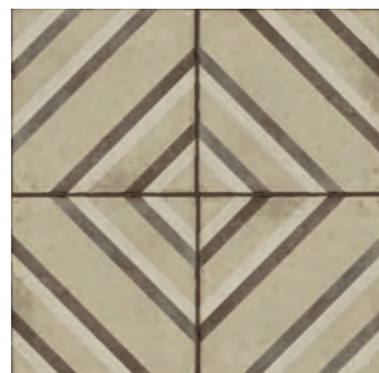
R86Y Ottocento Decoro Tappeto 8 Ambra* 20x20 - 7 7 / 8 " x 7 7 / 8 " H