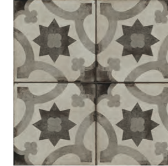
R873 Ottocento Decoro Tappeto 2 Talco* 20x20 - 7 7/8" x 7 7/8" H