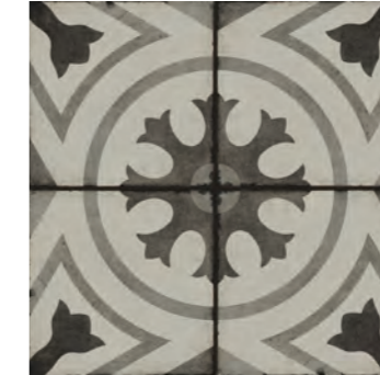
R87D Ottocento Decoro Tappeto 5 Talco* 20x20 - 7 7/8" x 7 7/8" H