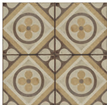
R86X Ottocento Decoro Tappeto 7 Ambra 20x20 - 7 7 / 8 " x 7 7 / 8 " H