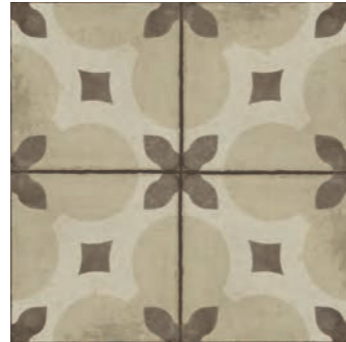
R86W Ottocento Decoro Tappeto 6 Ambra* 20x20 - 7 7 / 8 " x 7 7 / 8 " H