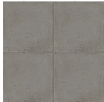
RKMR Ottocento Pomice 20x20 - 7 7/8" x 7 7/8" H