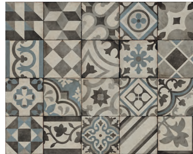
RFFX Ottocento Decoro Mix Talco** 20x20 - 7 7 / 8 " x 7 7 / 8 " H