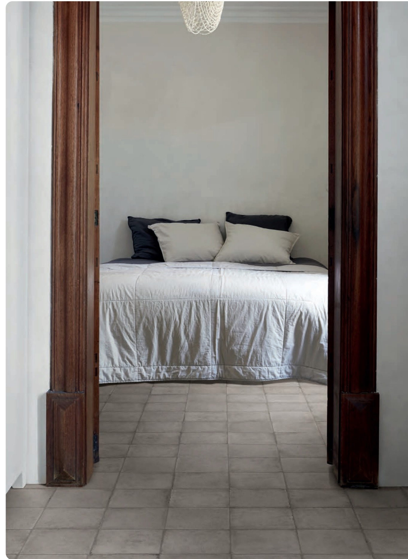
RKMR Ottocento Pomice 20x20 - 7 18 x 7 18